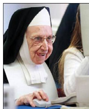
Almost everybody is on the Web...